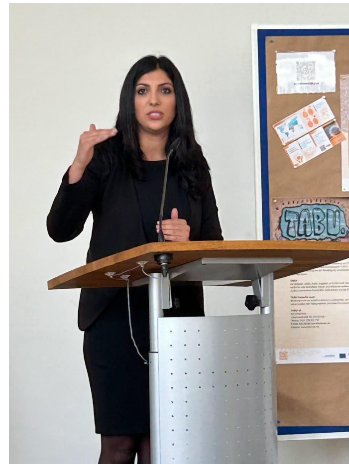
Die Migrationsbeauftragte und Landtagsabgeordnete der CDU aus dem Landtag, Seyran Papo, hielt ein Grußwort.