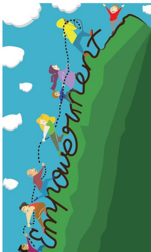
Grafik: Hala Ismaeil und Ziad Zankello